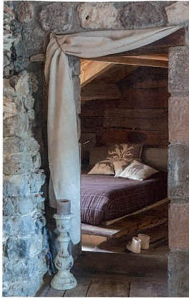
TELLE UNE CELLULE, cette chambre fermée par un simple pan de tissu offre un havre de paix tout en simplicité.

d'Aurillac, repose sur le sol, autrefois pavé, revêtu d'un simple plancher d'étable brut récupéré dans une ferme des environs.