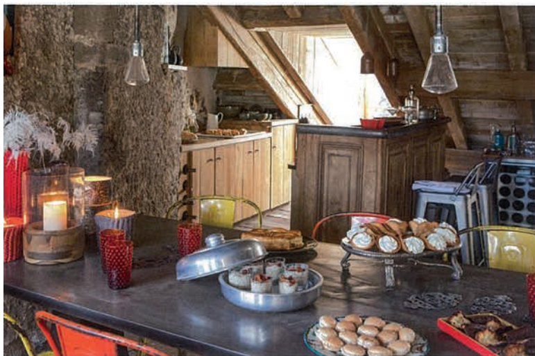
LE MOBILIER INDUSTRIEL cohabite avec aisance avec le bois. La longue table en béton ciré accueille les gourmands avec des cornets de Murat (Pâtisserie Troupenot, à Aurillac). Vases tricot (Angel des Montagnes).

Le centre de ralliement familial se cache sous les toits, dans l'ancien grenier-séchoir où les artisans tanneurs faisaient sécher les peaux. Un écrin de bois à l'esprit chalet où l'imposante charpente répond aux vieilles planches de chêne du sol. Pour casser les codes, une grande table au plateau en béton ciré monté sur un piétement de machine-outil (réalisation du designer lyonnais Axel-Olivier Icard), encadrée de chaises Tolix, jaunes et rouges, s'invite dans le décor d'inspiration industrielle. Aujourd'hui, cette maison d'hôte pas comme les autres est un repaire secret, pieusement gardé et une adresse qui se murmure à l'oreille. ●